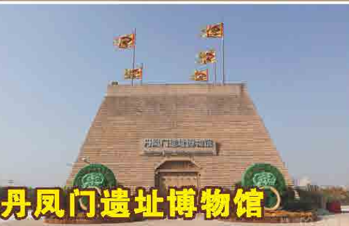
丹鳳門遺址博物館