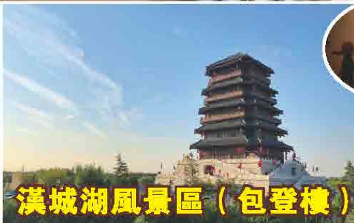
漢城湖風景區 (包登樓)