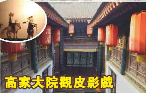
高家大院觀皮影戲