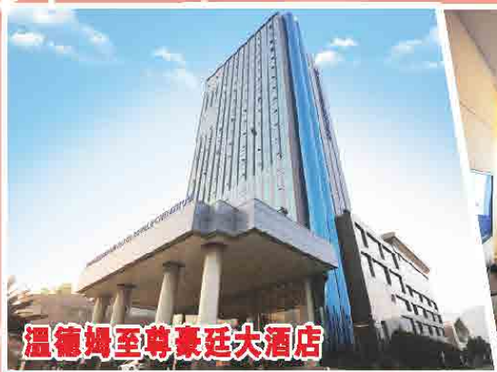
溫德姆至尊豪廷大酒店