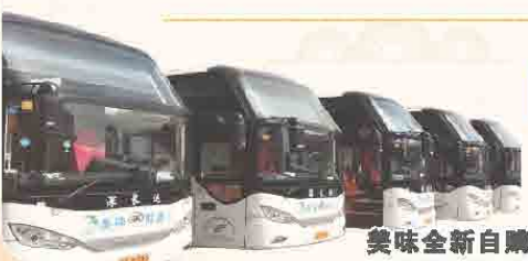
美味全新自購旅遊車

DAY2 酒店自助早餐 → 潮州古城 (重本包乘坐電瓶車、潮州古城牆、湘子橋外觀、廣濟樓、牌坊街) → 午餐 (老字號老柯潮式脆香蠔烙+秘制反沙芋頭+老柯自創酸甜餃+特色鹹水粿一人一份潮州千錘百煉手打牛肉丸胡榮泉鴨母捻糖水 (一人一碗) +潮汕特色春餅) → 廣東四大名寺之開元寺 → 晚餐 → 入住酒店