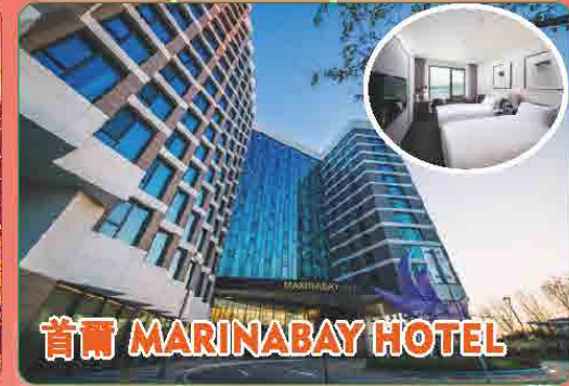
首爾 MARINABAY HOTEL