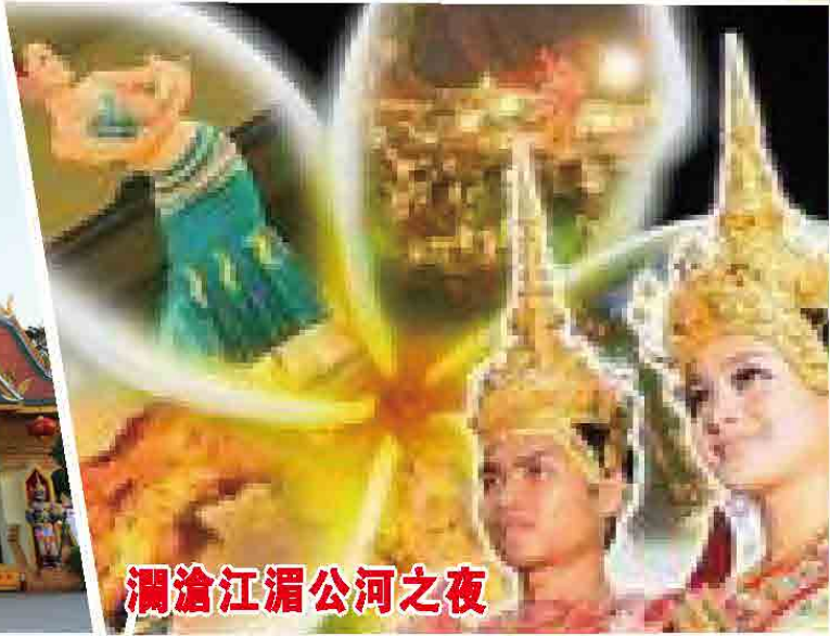
瀾滄江湄公河之夜