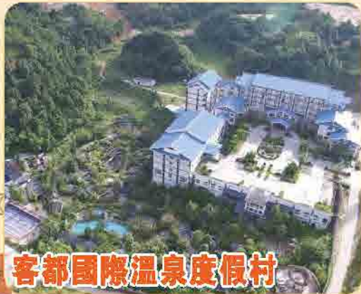
客都國際溫泉度假村

世界文化遺產“土樓王子”——振成樓、土樓之王——承啟樓 客家博物館 全程5星 客都國際溫泉度假村 巴士純玩3天