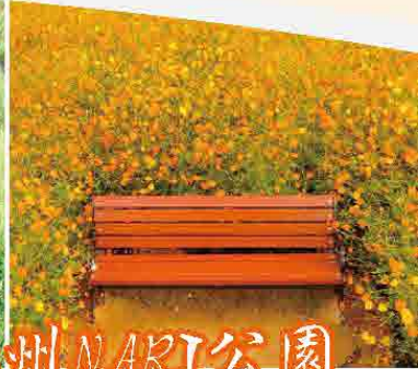
首爾近郊揚州NARI公園