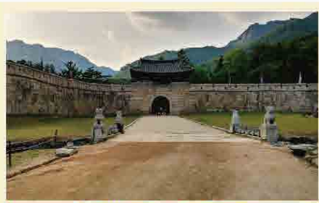
鳥嶺 KBS 攝影場