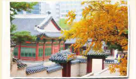
德壽宮紅葉石牆路