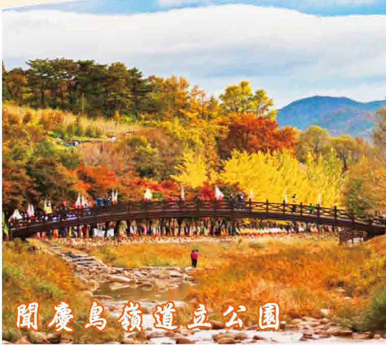
聞慶鳥嶺道立公園