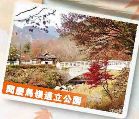
聞慶鳥嶺道立公園