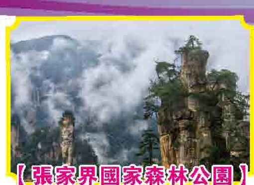
【張家界國家森林公園】