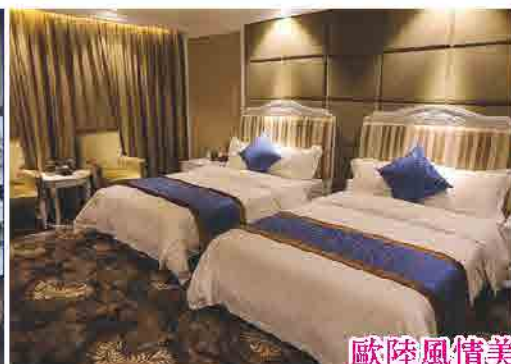
歐陸風情美林國際酒店