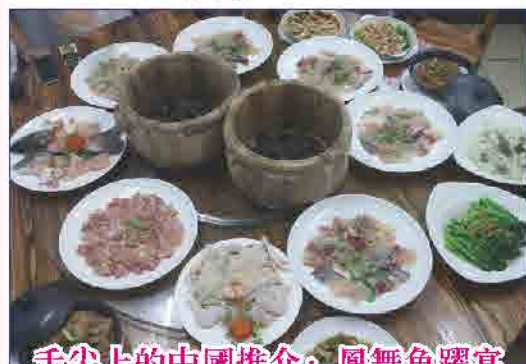
舌尖上的中國推介：鳳舞魚躍宴