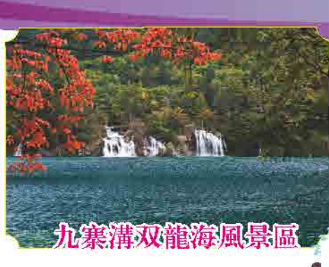
九寨沟双龍海風景區